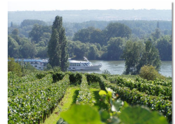
Blick aus den Weinbergen