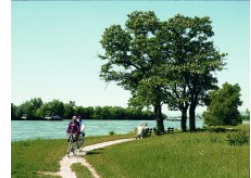
Der Rhein in Hattenheim