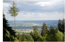
Ortsansicht vom Berg